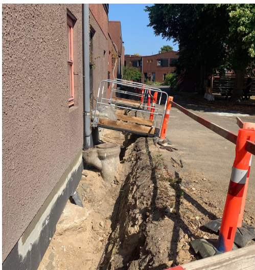
Udgravning til dræn og sokkelisolering.