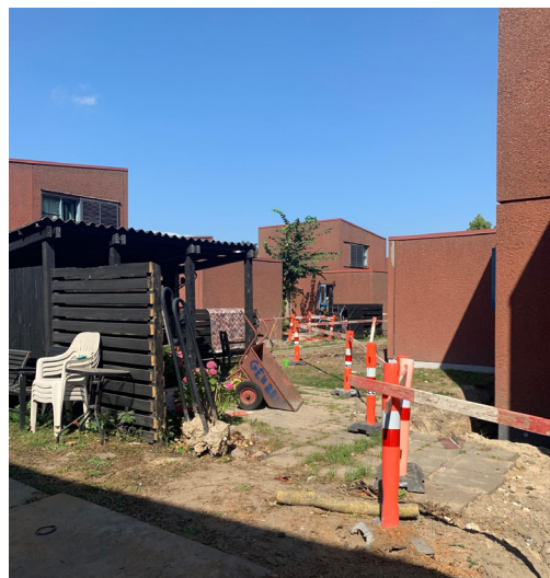
Opgravning rundt om alle boliger tager alt plads i haven.