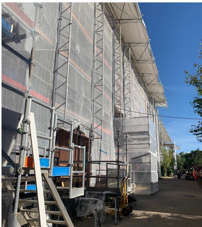
Pladsen er trang, og der er ikke meget plads til de forskellige arbejder.

Der bores med tørborring, så der kommer ikke vand ind i boligerne, mens arbejdet udføres. Ventilation etableres for at gøre indeklimaet i boligerne bedre.