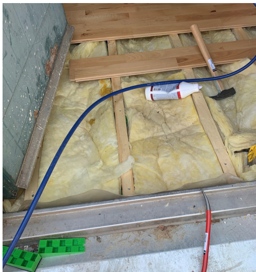
Isolering og nyt gulv i entré.

Henvend dig kun på ejendomskontoret, hvis du spørgsmål vedrørende hverdagen i din bolig dvs. den daglig drift af bygninger og bolig som fx problemer i vaskerierne.