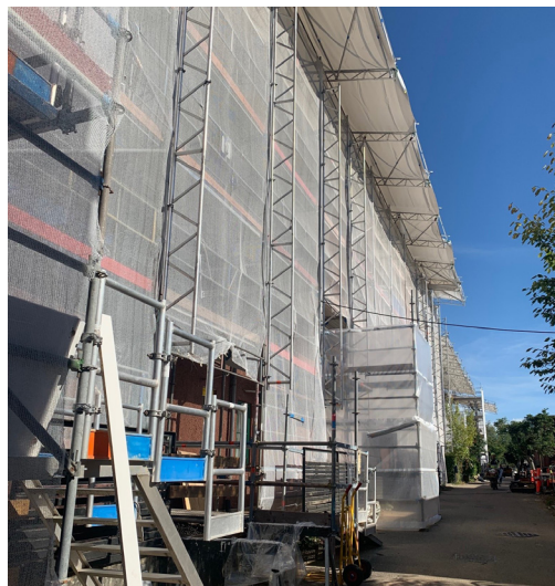
Etablering af nye tage.